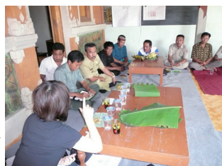
チーム 14 とのワークショップ

国立公園は、あいあいネットとの活動のために 14 名の現場職員から成るプロジェクトチーム（チーム 14）を結成しました。これまで、チーム 14 はあいあいネットとともに「村人とのパートナーシップ作り」「観察と仮説作り」「インタビューと仮説の検証」等についてワークショップを行いました。チーム 14 のメンバーの中で、徐々にファシリテーターとしての心構えや技術がつか始めています。