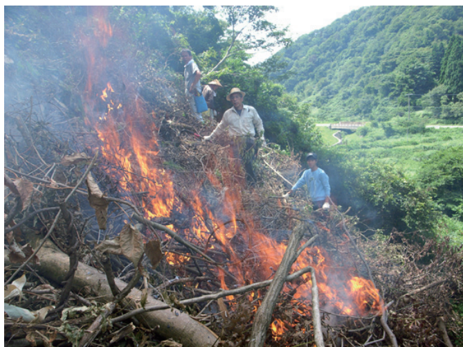
火入れの様子 / 滋賀県余呉町

また、京都大学の研究プロジェクト「在地と都市がつくる循環型社会再生のための実践型地域研究」に増田・島上が関与し、滋賀県の朽木・椋川、および余呉町での実践的研究を進め、地元の方々との関係を深めました。