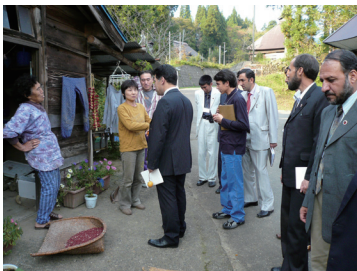
地元の方へのインタビュー (新潟県上越市)

2007 年度に引き続き、アフガニスタンで地方行政能力強化や地域開発に取り組む JICA 技術協力プロジェクトのカウンターパートへの研修を実施しました（10 月 8 日～25 日）。10 名の行政官が来日し、日本の市民社会の活動と行政の支援を視察することを通じて、住民主体の地域づくりと行政の役割を学びました。