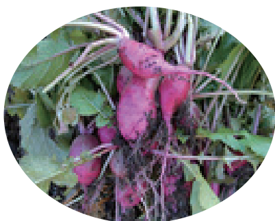
焼畑で栽培した山かぶら

※「田んぼは水、山は火で蘇る」。火野山ひろばは滋賀県内で、火で野山を蘇らせる活動をしています。