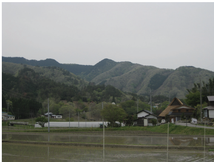
京都大学の研究プロジェクト、日本財団 API フェローシップ交流プロジェクトの活動場所、滋賀県椋川地区