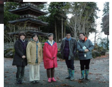
地元のNPOメンバーと記念撮影 (佐渡島)