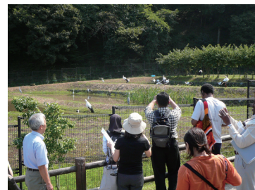
←コウノトリの研究・増殖施設を見学（兵庫県豊岡市）

本年度で 5 回目となる課題別研修「市民社会活動の促進とコミュニティ開発」は、7 カ国 11 名の研修員が参加して JICA 東京で実施されました（9 月 9 日～10 月 1 日）。例年通り「コミュニティと外部者の役割」「ソフトシステムズ方法論」といったワークショップに加え、兵庫県豊岡市を訪れてコウノトリ野生復帰をテコとした「環境と経済の共鳴」を学び、さらに熊本県菊池市水源地域を訪問して、廃校を活用した住民主体のグリーンツーリズムに触れて、地域資源の活用と住民イニシアティブの現場に触れることができました。