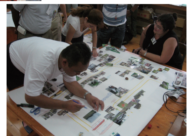
→地域資源をまとめた絵地図づくりに取り組む（熊本県菊池市）