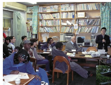
NPO活動家たちとの意見交換 (神戸市)