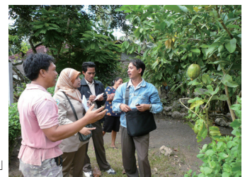
村での「あるものさがし」

チーム 14 と村を歩き、「あるものさがし」を行なったほか、村人ともそれを共有するワークショップを実施しました。活動対象地域の一つプリンビンサリ村では、村人が国立公園内の滝とその周辺を公園として整備していきたいとの要望を公園に出しており、既に公園と村との協働活動の芽が育ち始めています。