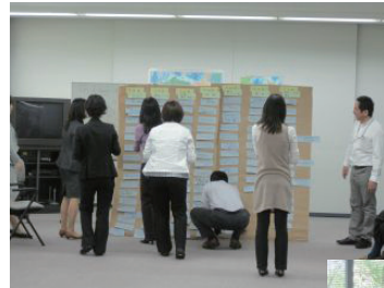
JICA 大阪でのワークショップの様子（写真 2 枚とも）

JICA 国内事業部が JICE に委託した「効果的な研修ファシリテーション」教材作りに対して協力し、取材と教材の原稿作り、およびワークショップの開催を行ないました。JICA が実施する本邦研修において、「研修員が主体となる学び」を促すファシリテーションという考えを広く適用してもらうことを目指したこの教材は、2009 年 7 月に完成し、JICA センターを通じて各受け入れ先等で活用されることが期待されています。